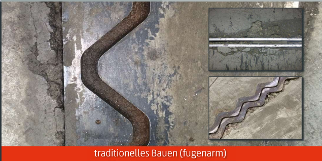
traditionelles Bauen (fugenarm)

SIMA Gleittechnologie® nach über 40 Mio. Überfahrten